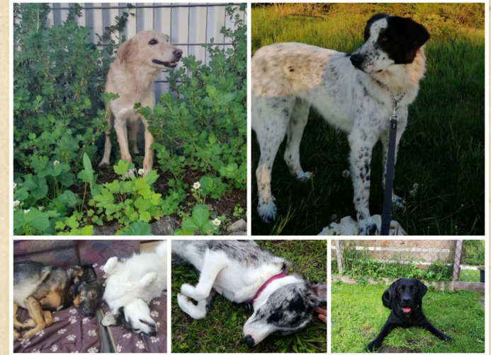
2022: Merlin, Frieda, Marley & Emma, Nala, Vegas